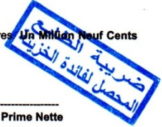
Tableau des Garanties :

Les garanties du présent contrat sont accordées moyennant une prime nette de : 1,914,040.00 DA , soit en lettres Un Million Neuf Cents Quatorze Mille Quarante Dinars 00 Centimes Le détail de cette prime nette est donné par le tableau ci après :